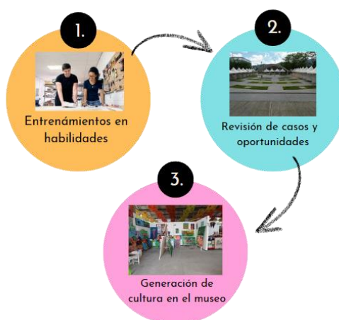
Ilustración 2. Fortalecimiento técnico

Se realizarán entrenamientos en la línea creativa y cultural, donde los emprendimientos podrán fortalecer habilidades técnicas para mejorar la prestación del servicio o elaboración de su producto, enfocándose en el tema cultural. Tales como manipulación de alimentos, gastronomía, turismo, certificaciones, entre otros.